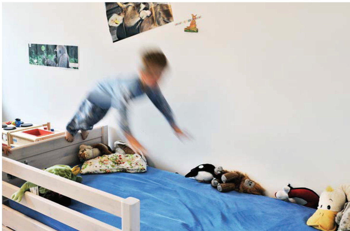
Die Kinder sind bald die stärkste Gruppe im Mehrgenerationenhaus.

oder sich von einer jungen Mitbewohnerin Spanisch beibringen lässt.