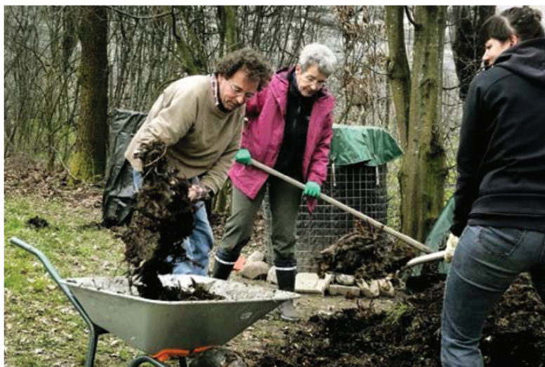
Zweimal im Jahr werden an gemeinsamen Aktionstagen Garten und Terrasse auf Vordermann gebracht.

Marco Hoffmann, Andreas Huber: Begleitstudie Kraftwerk1 Heizenholz. 2010–2014. Hrsg. von immoq Gmbh / age stiftung / Kraftwerk1 Bau- und Wohngenossenschaft. Download über www.kraftwerk1.ch .