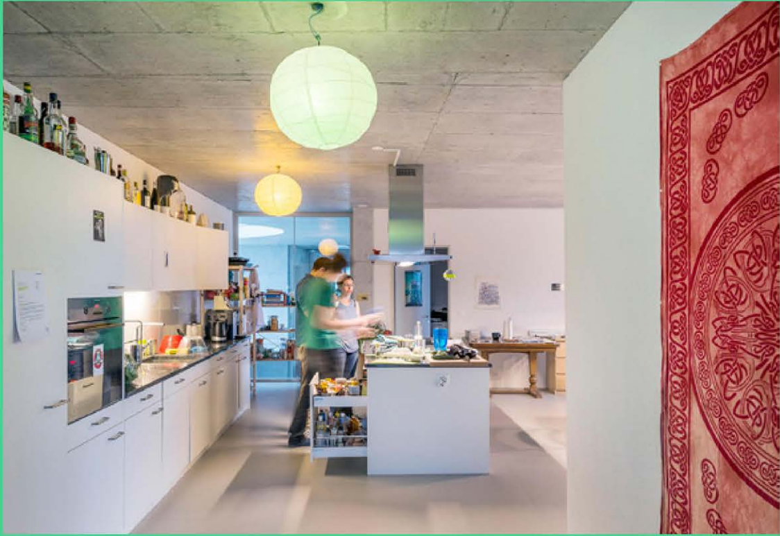
↓ gezamenlijke keuken tussen enkele clusterappartementen van Haus A, Mehr Als Wohnen, Hunziker Areal, Zürich (CH) ©Duplex Architekten, beeld: Johannes Marburg