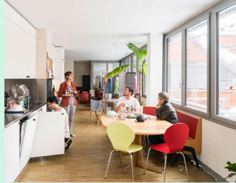
↑ clusterwonen in CODHA, Genève (CH) ©Dreier Frenzel, beeld: Eik Frenzel