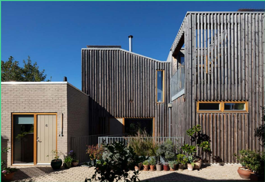
↑ gevels regelen de privacy tussen de woningen en de collectieve binnenplaats, Copper Lane, Londen (UK) ©Henley Halebrown Architects, beeld: Nick Kane