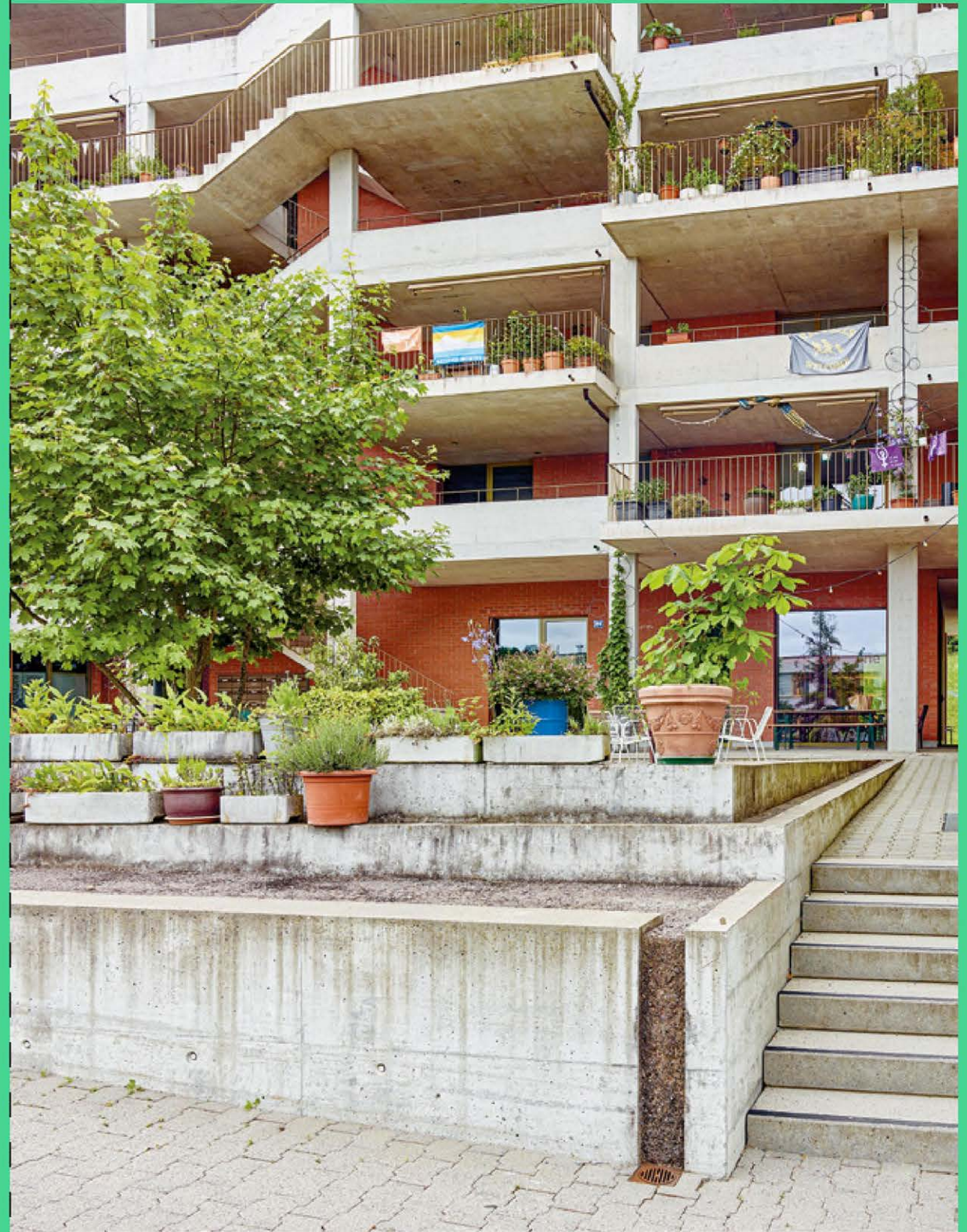
↑ royale ontsluiting als verblijfs- en ontmoetingsruimte, Kraftwerk1 Heizenholz, Zürich (CH) ©Adrian Streich Architekten, beeld: Jürg Zimmermann