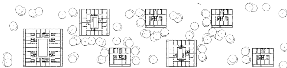
Wohngeschoss → Residential floor