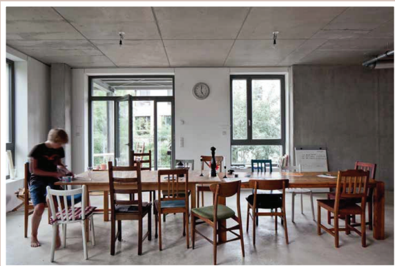
Oben: Top: B&Gwold, Berlin, 2009, Architektinnen: Zanderweh Architektinnen, Herburg Landeshaushaltsarchitekten Unten: Bottom: Spewfeld, Berlin (2014), Architektinnen: ARGE Carpaneto, FAT Köhl, BAR Architektinnen, Die Zusammenarbeiter