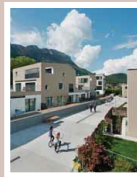
Wohnanlage am Berg, Katern, 2007, Architektinnen: Röhrl Architektinnen, Foto: Heiko Gassen