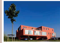
Villa von Wilm, Althaus, 2006, Architektoren: S&S Architects, Foto: Jan Woldrich