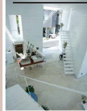
Ardebaran, Vohlsdorf, 2010, Architektinnen: D3 Architects